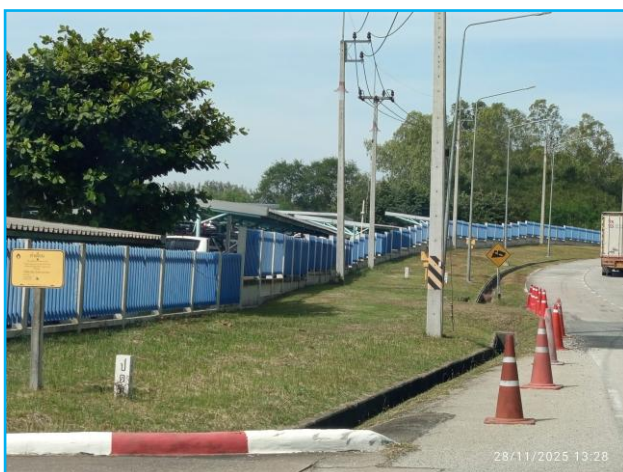
ป้ายเตือนแนวทอส่งก๊าซ บริเวณโรงงาน