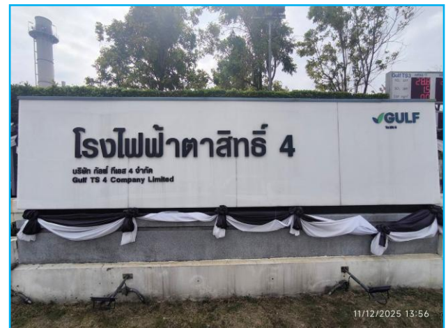
บริเวณด้านหน้าโรงงาน