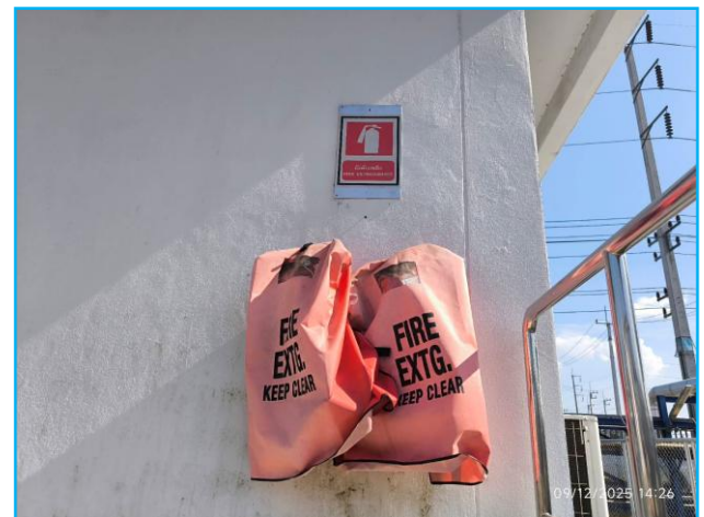
ถังดับเพลิงบริเวณทอส่งก๊าซ