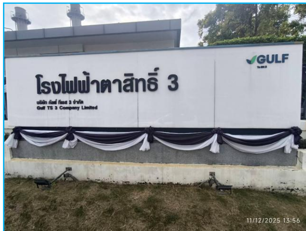
บริเวณด้านหน้าโรงงาน