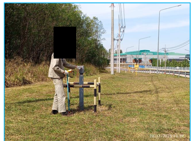
พนักงานสวมใส่ชุด PPE

ภาพที่ 3.2-17 ภาพถ่ายระบบรักษาความปลอดภัยตามแนวทอส่งก๊าซฯ และบริเวณสถานีก๊าซฯ ของโครงการทอส่งก๊าซธรรมชาติไปยังโรงไฟฟ้าตาสีทรี 4 โรงไฟฟ้าตาสีทรี 3