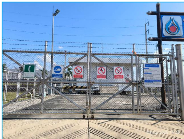
ป้ายเตือนต่าง ๆ บริเวณสถานีควบคุมความดันก๊าซ (MRS)